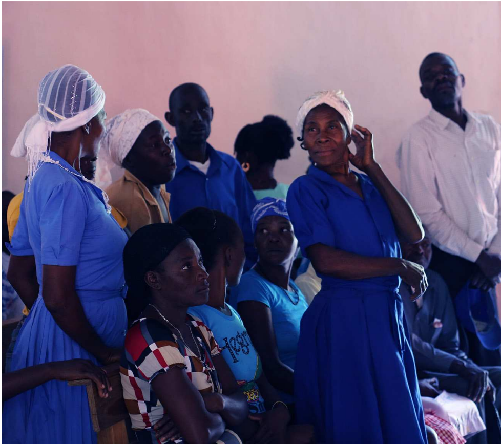
Femmes de Cornillon en séance de travail avec la "Communauté de Médiateurs"

ASSOCIATION DUCHAMPS-LIBERTINO Pour l'Encouragement de la Sagesse et de la Paix dans le Monde